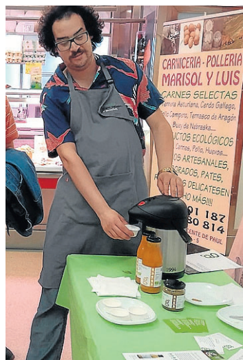
Un momento de la cata.

La cata de productos agroecológicos de Gardeniers en el Mercado de Valdespartera que anunciamos por error para el viernes pasado, se llevará a cabo en realidad durante el día de hoy, viernes, a partir de las 11.00. En la cata se ofrecerán productos artesanales y ecológicos como las cremas y salsas, elaboradas en el obrador propio de conservas ecológicas, y algunas novedades, como la crema de calabaza con manzana. El Mercado de Valdespartera es uno de los tres en los que Gardeniers tiene actualmente presencia, junto al Mercado de San Vicente de Paúl y